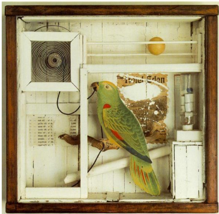
Το ξενοδοχείο Εδέμ, Τζόζεφ Κορνέλ