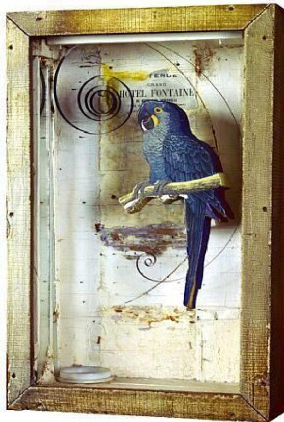
Οι άγγελοι του Κίβι, Τζόζεφ Κορνέλ